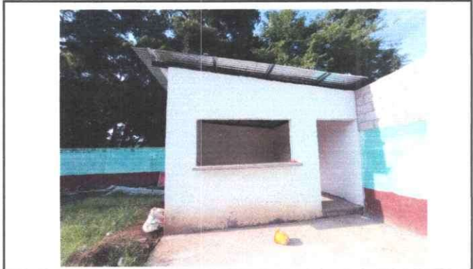
Foto 8: Vista exterior cocina, con intervención de remozamiento con suministro de ventana, puerta y aplicación de pintura.