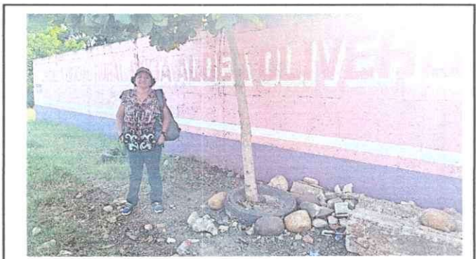
Foto 12: Vista de fachada en el establecimiento, presencia concurtera.