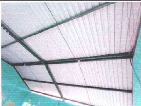
Foto 5: Vista módulo 2 de aulas, con intervención de remozamiento con mantenimiento a estructura de techo.