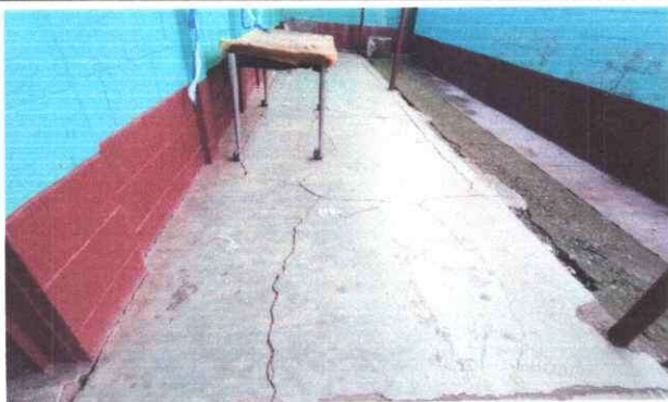
Foto 3: Vista exterior de módulo 1 de aulas, con intervención de remozamiento con instalación de piso cerámico antideslizante.