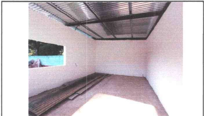
Foto 10: Vista interior en cocina, con intervención de remozamiento con suministro de pintura en muros interior.