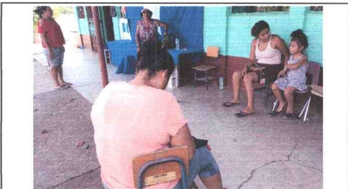
Foto 11: Vista de reunión para levantado de acta y firma de documentos por OPF, directora y consultora.