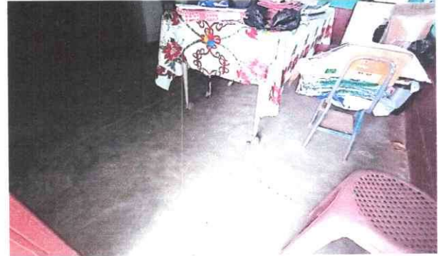
Foto 2: Vista interior de módulo 1 de aulas, con intervención de remozamiento con instalación de piso cerámico antideslizante.