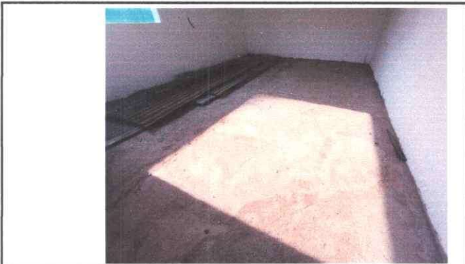
Foto 9: Vista interior en cocina, con intervención de remozamiento con suministro de pila.