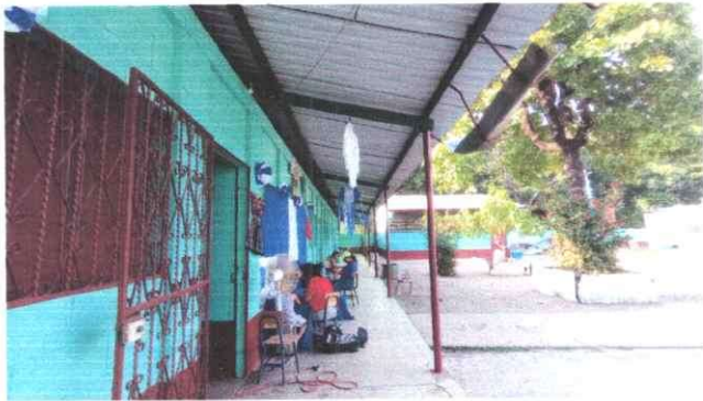
Foto1: Vista exterior de módulo 1 de aulas, con intervención de remozamiento con suministro e instalación de canal y bajas de agua pluvial.