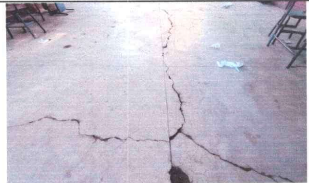
Foto 4: Vista interior de módulo 1 de aulas, con intervención de remozamiento con instalación de piso cerámico antideslizante.